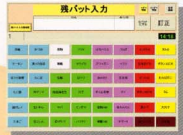
●残バット入力画面